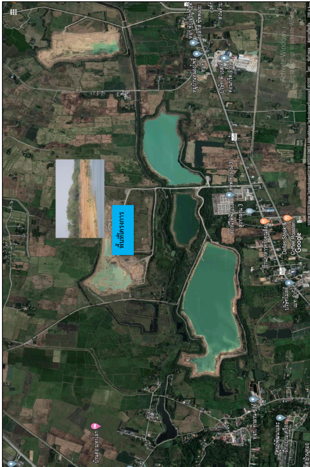
ภาพที่ 1.1 แผนผังโครงสร้างบริษัทชินนิส (ท่าหลวง) จำกัด